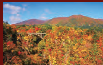
鳴子峡(宮城県大崎市)